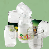
Bocaux de conserves et pots en verre