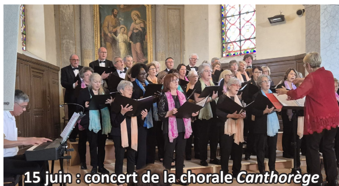
15 juin : concert de la chorale Canthorège