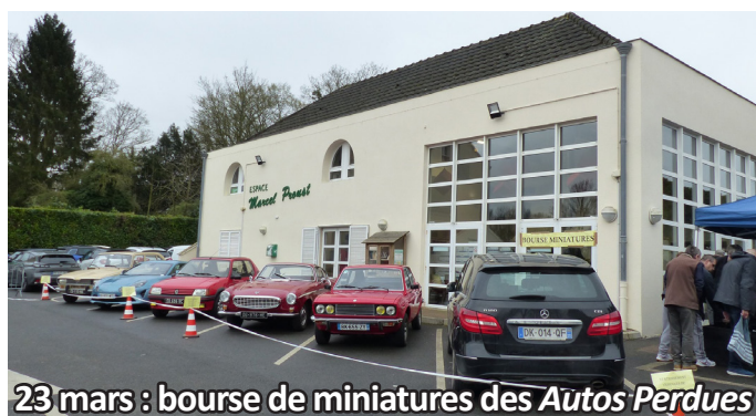
23 mars : bourse de miniatures des Autos Perdues