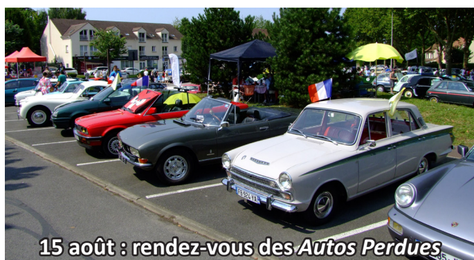
15 août : rendez-vous des Autos Perdues