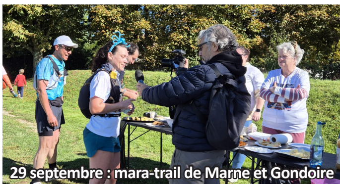
29 septembre : mara-trail de Marne et Gondoire