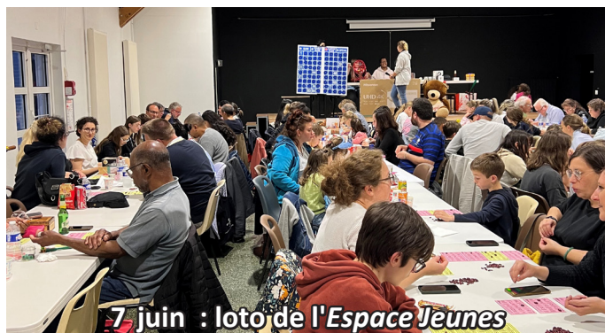
7 juin : loto de l'Espace Jeunes