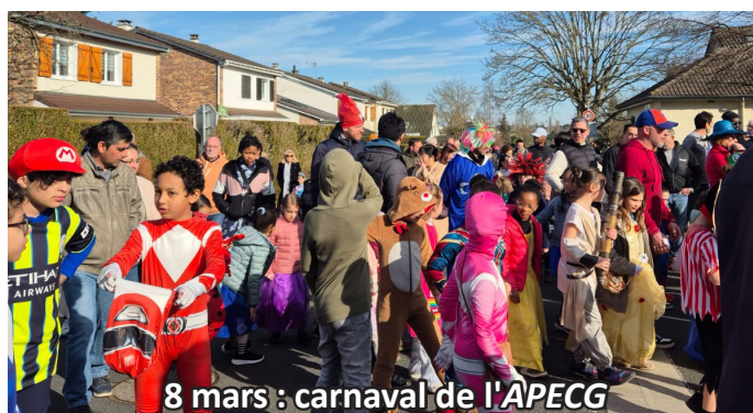
8 mars : carnaval de l'APECG