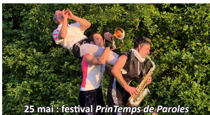
25 mai : festival PrinTemps de Paroles