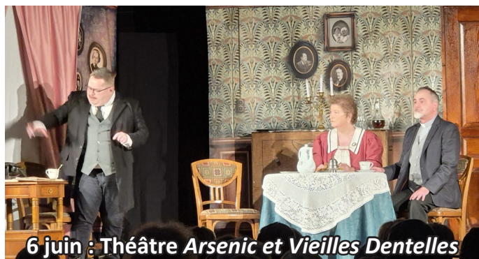
6 juin : Théâtre Arsenic et Vieilles Dentelles