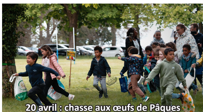
20 avril : chasse aux œufs de Pâques