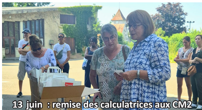
13 juin : remise des calculatrices aux CM2