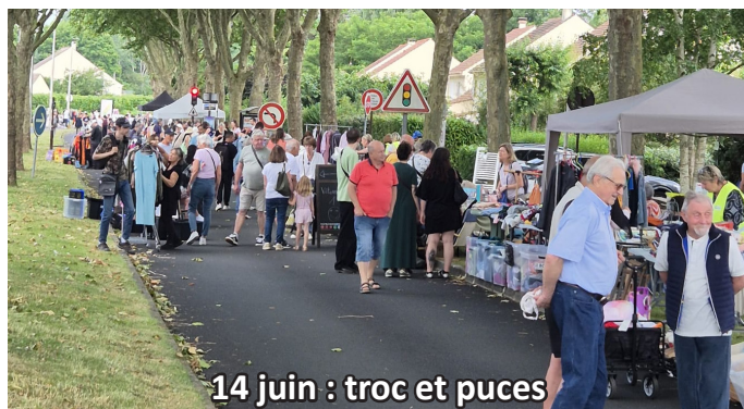
14 juin : troc et puces