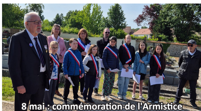
8 mai : commémoration de l'Armistice