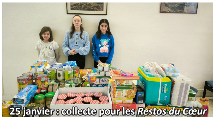
25 janvier : collecte pour les Restos du Cœur