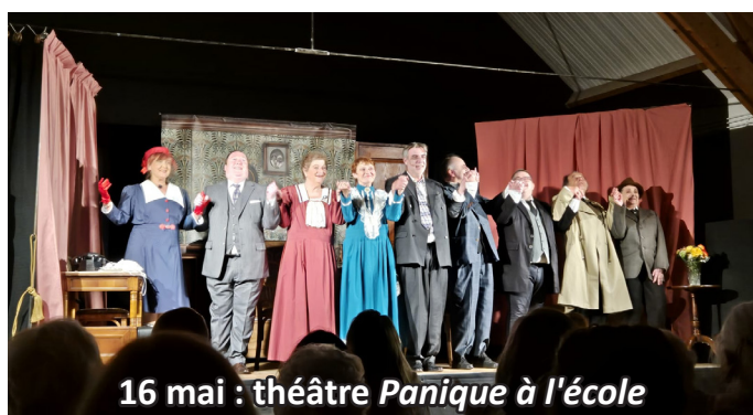
16 mai : théâtre Panique à l'école