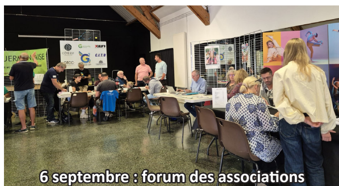
6 septembre : forum des associations