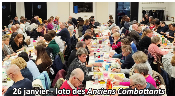
26 janvier - loto des Anciens Combattants