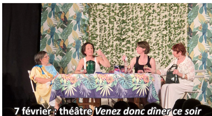
7 février : théâtre Venez donc dîner ce soir