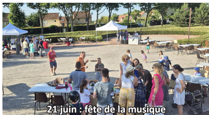
21 juin : fête de la musique