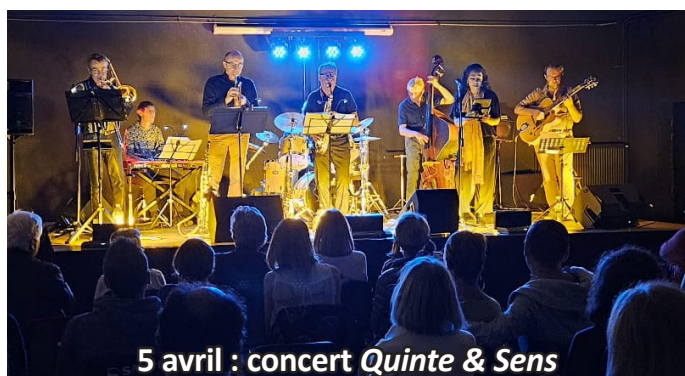
5 avril : concert Quinte & Sens