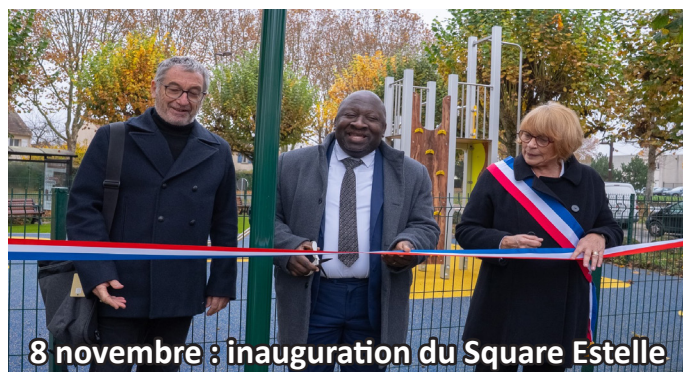
8 novembre : inauguration du Square Estelle