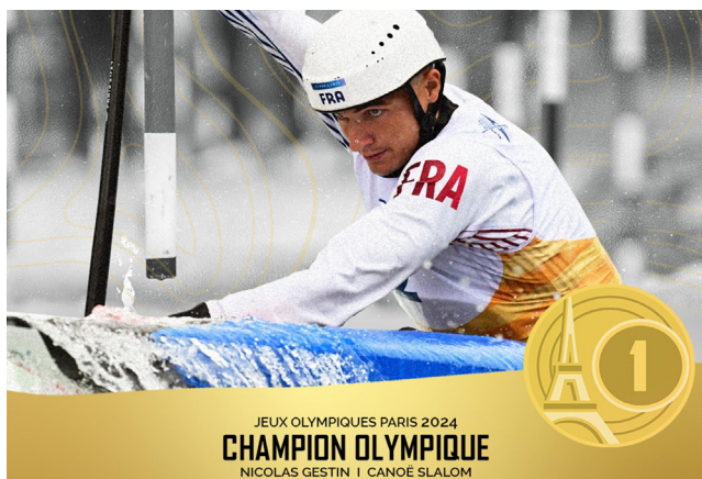
JEUX OLYMPIQUES PARIS 2024 CHAMPION OLYMPIQUE NICOLAS GESTIN | CANOË SLALOM