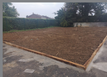
Démolition des préfabriqués de la cour de l'école du Val Guermantes