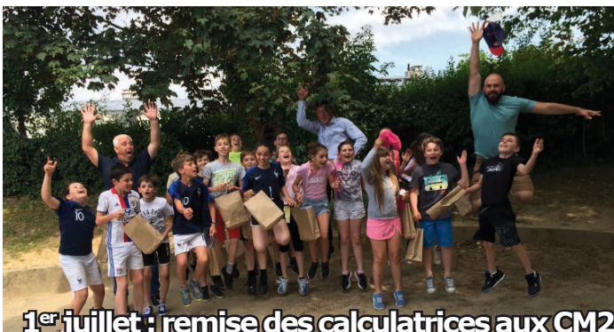
1 er juillet : remise des calculatrices aux CM2