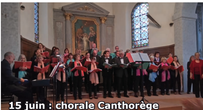
15 juin : chorale Canthorège