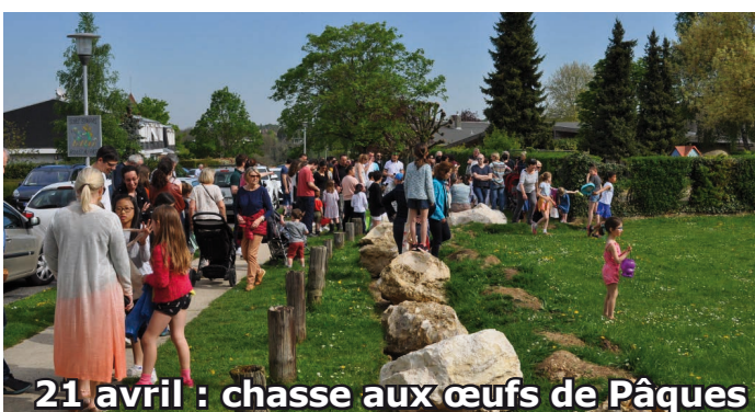
21 avril : chasse aux œufs de Pâques