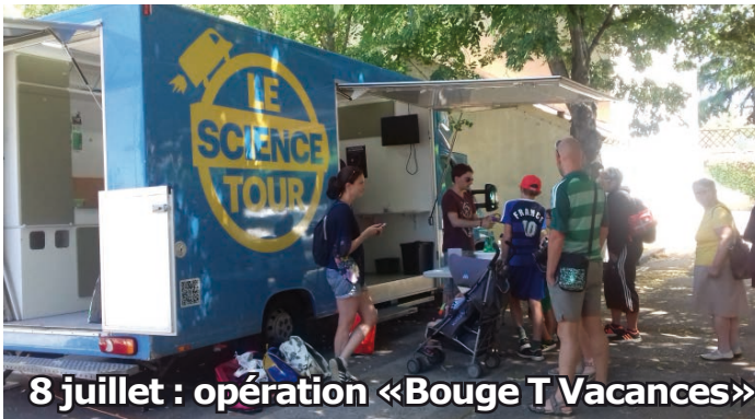
8 juillet : opération «Bouge T Vacances»