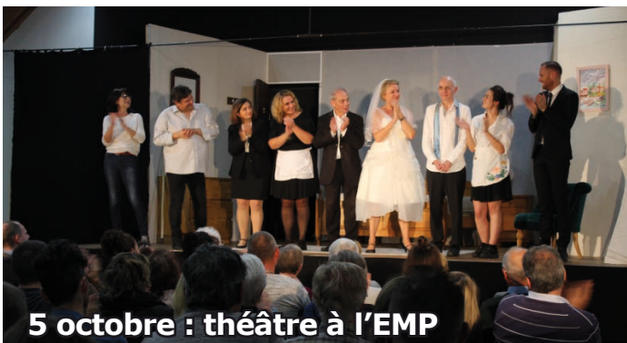
5 octobre : théâtre à l'EMP