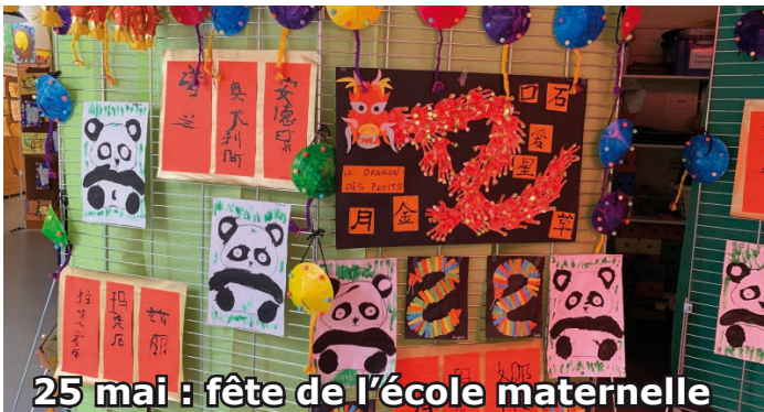
25 mai : fête de l'école maternelle