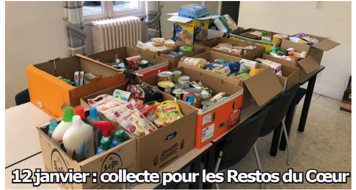
12 janvier : collecte pour les Restos du Cœur