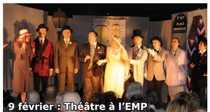
9 février : Théâtre à l'EMP