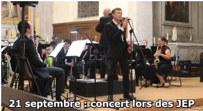
21 septembre : concert lors des JEP