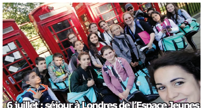
6 juillet : séjour à Londres de l'Espace Jeunes