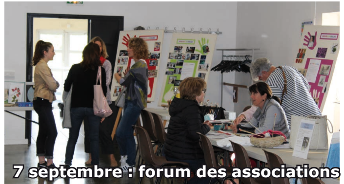
7 septembre : forum des associations