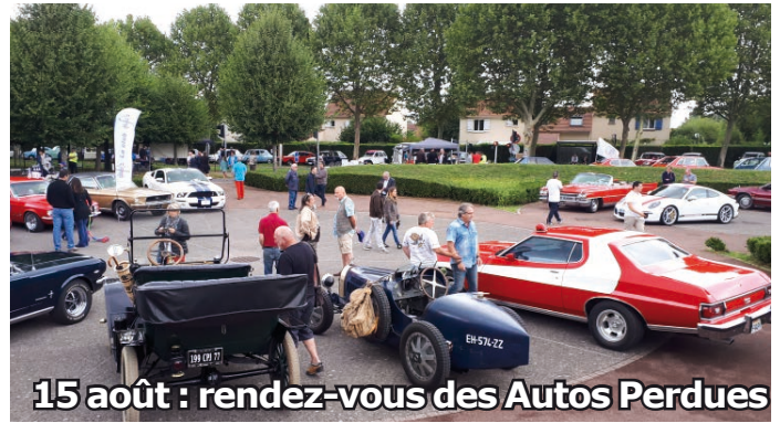
15 août : rendez-vous des Autos Perdues