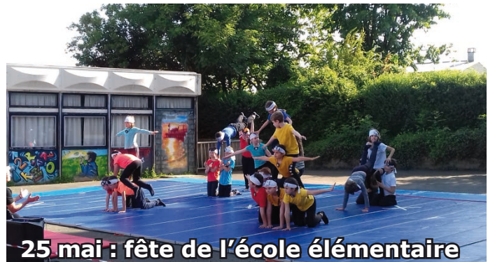
25 mai : fête de l'école élémentaire