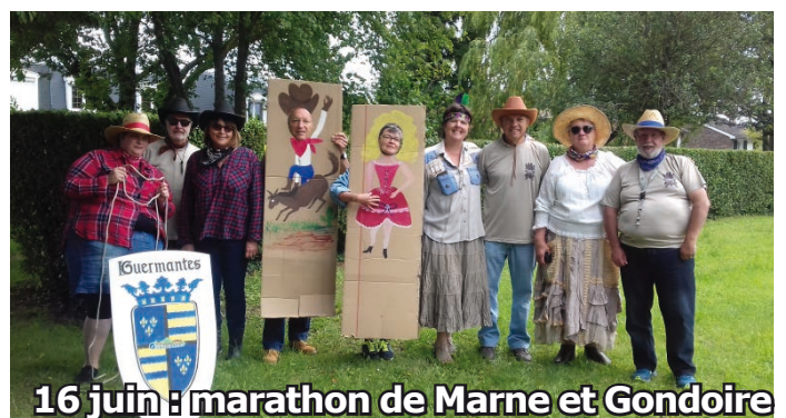
16 juin : marathon de Marne et Gondoire