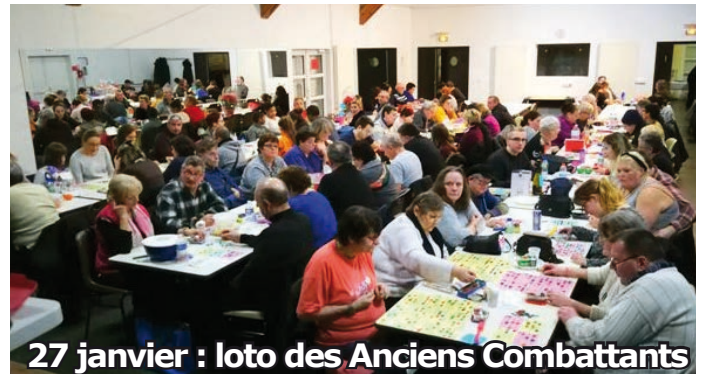
27 janvier : loto des Anciens Combattants