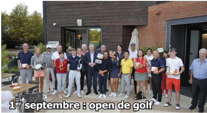
1 er septembre : open de golf