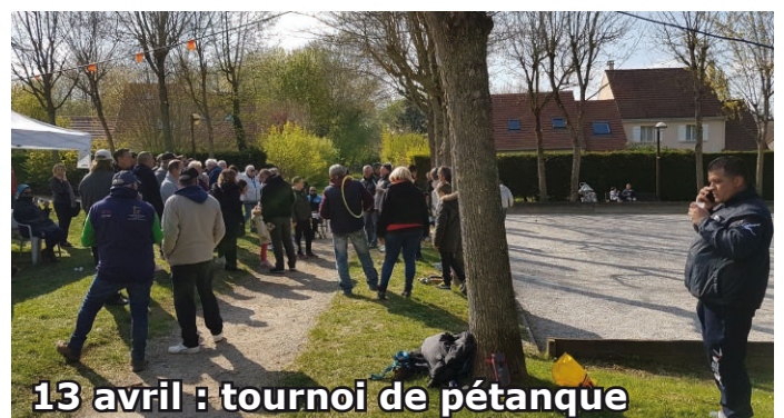
13 avril : tournoi de pétanque