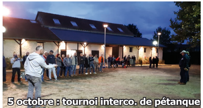
5 octobre : tournoi interco. de pétanque