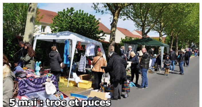
5 mai : troc et puces