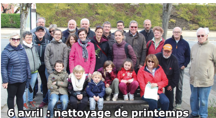
6 avril : nettoyage de printemps