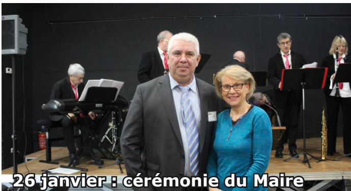
26 janvier : cérémonie du Maire