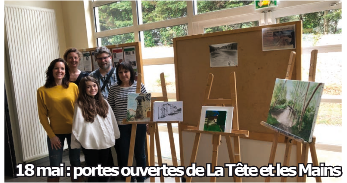
18 mai : portes ouvertes de La Tête et les Mains