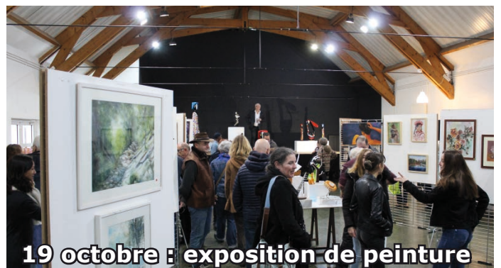
19 octobre : exposition de peinture