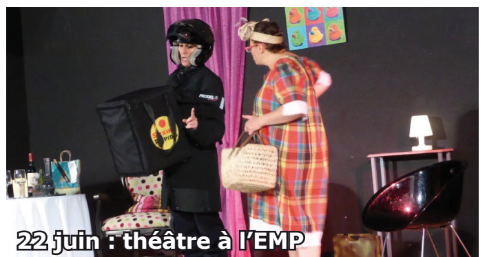
22 juin : théâtre à l'EMP