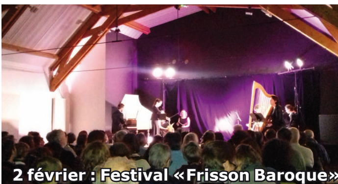
2 février : Festival «Frisson Baroque»