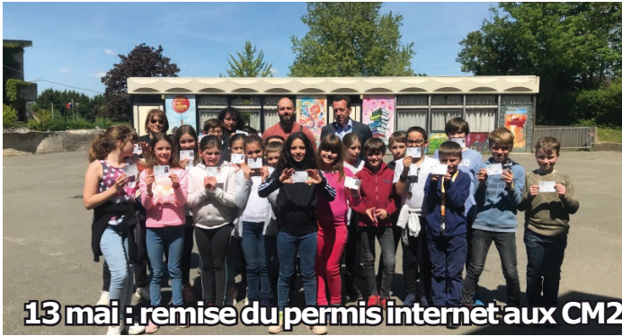
13 mai : remise du permis internet aux CM2