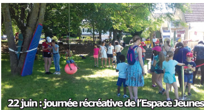
22 juin : journée récréative de l'Espace Jeunes