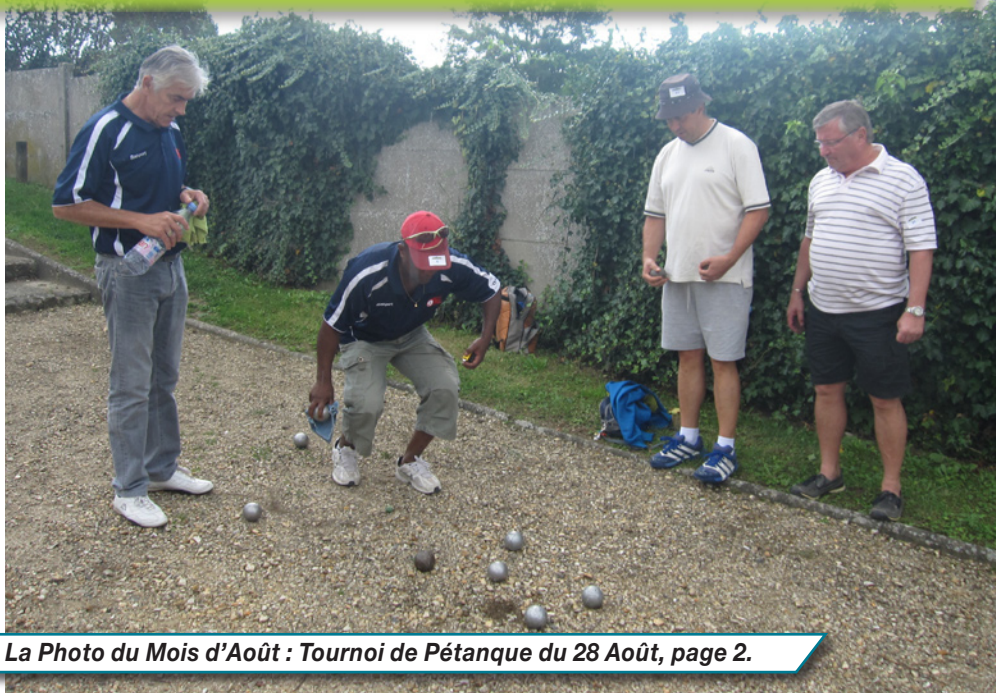
La Photo du Mois d'Août : Tournoi de Pétanque du 28 Août, page 2.