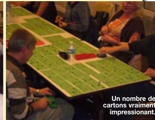
Un nombre de cartons vraiment impressionnant.