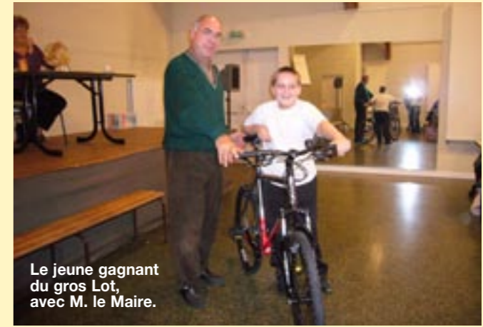
Le jeune gagnant du gros Lot, avec M. le Maire.

Un grand merci au trop peu nombreux bénévoles présents... et à ceux qui ont donné leur temps pour la préparation, ainsi qu'aux nombreux sponsors qui ont permis aux invités de gagner de magni-