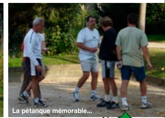
La pétanque mémorable...