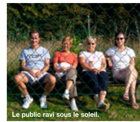
Le public ravi sous le soleil.

Le tout s'est achevé par une partie de pétanque mémorable où certains ont montré toute la diversité de leurs talents.