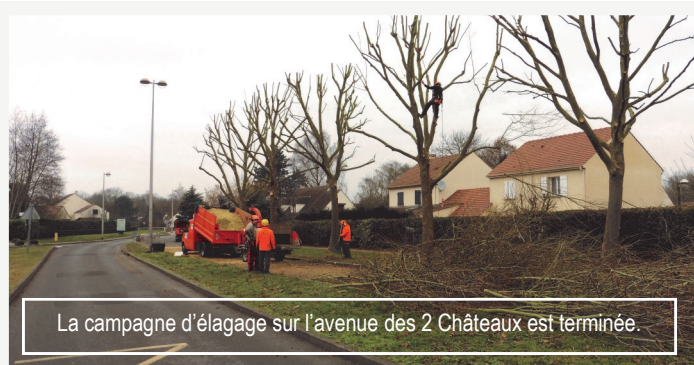
La campagne d'élagage sur l'avenue des 2 Châteaux est terminée.

La loi laisse encore 2 ans aux particuliers pour cesser d'utiliser ces produits nocifs. Avant cette échéance, pourquoi ne pas changer nos habitudes ; par exemple, recourir au paillage qui permet de limiter l'usage des désherbants ou planter des végétaux couvre sol, des vivaces. Et, comme souvent encore les « mauvaises herbes » sont synonymes de manque d'entretien, il faut faire évoluer notre regard « écocitoyen ».