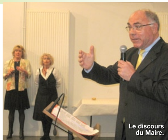
Le discours du Maire.