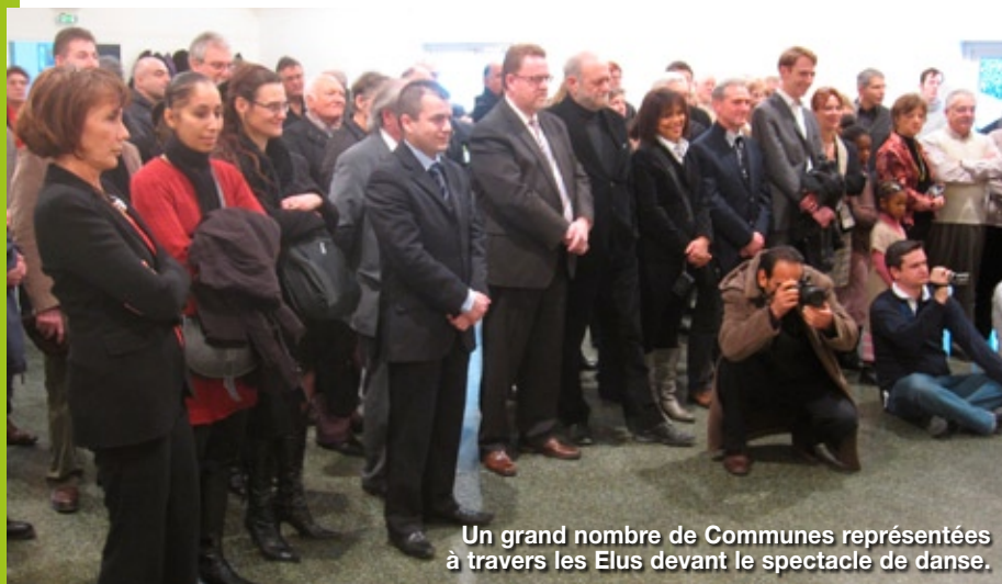
Un grand nombre de Communes représentées à travers les Elus devant le spectacle de danse.

Samedi 5 février à 11h30 les invités rejoignaient l'Espace Marcel Proust suite à l'invitation du Maire et du Conseil Municipal.