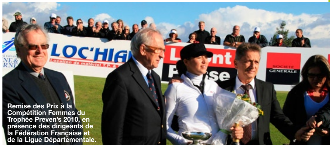
Remise des Prix à la Compétition Femmes du Trophée Preven's 2010, en présence des dirigeants de la Fédération Française et de la Ligue Départementale.