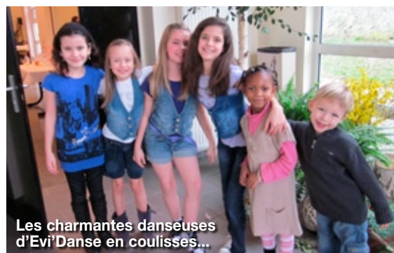
Les charmantes danseuses d'Evi' Danse en coulisses...