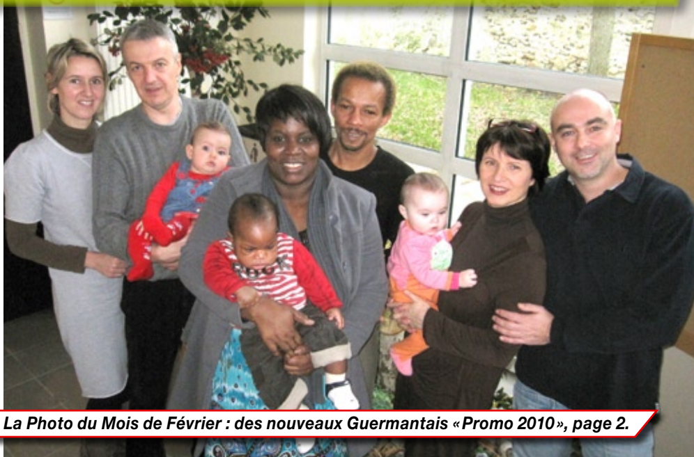
La Photo du Mois de Février : des nouveaux Guermantais « Promo 2010 », page 2.

A noter : le mandataire peut recevoir deux procurations seulement si au moins une de ces procurations émane d'un électeur établi à l'étranger.