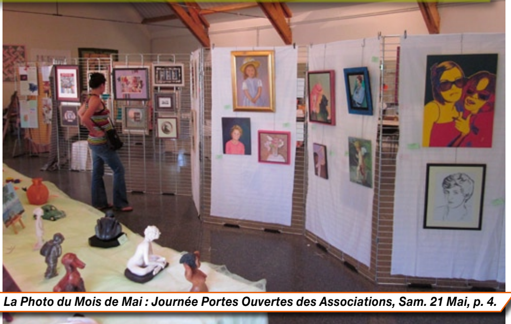
La Photo du Mois de Mai : Journée Portes Ouvertes des Associations, Sam. 21 Mai, p. 4.

9 juin : Le chat du Rabbin. 21 juillet : Low Cost. 11 août : Limitless. 15 septembre : Omar m'a tué. 20 octobre : The Artist. 10 novembre et 15 décembre : La source des femmes. Programme sous réserve. Tél. au 01 60 26 40 11 pour avoir confirmation du film projeté, la semaine précédant la séance. Cinéma LE CINQ. 5 rue Delambre. 77400 LAGNY-SUR-MARNE.