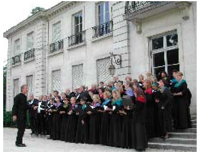
Article et photos du Prin'Temps de Paroles dans le prochain numéro.