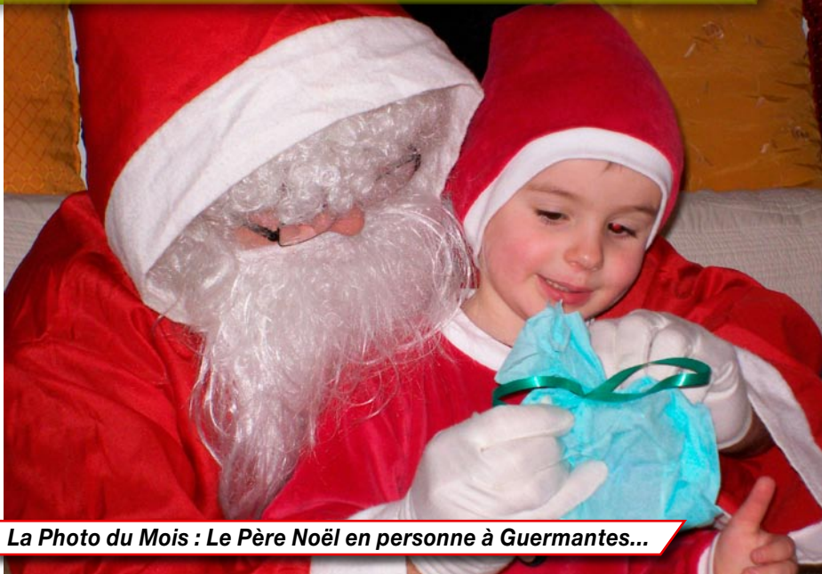
La Photo du Mois : Le Père Noël en personne à Guermantes...

avec M. le Maire. Merci à tous pour ce petit moment de bonheur et Bonne Année à tous les enfants et leurs parents ainsi qu'aux assistantes maternelles.