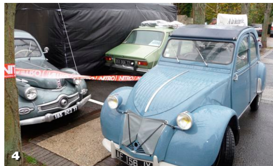
Prochain rendez vous : le dimanche 27 mars 2011. Nous y serons et vous ?