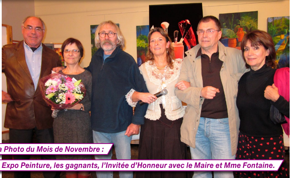
La Photo du Mois de Novembre :

... Pendant les fêtes. A l'occasion des fêtes de fin d'année: Vendredi 24 et 31 décembre, fermeture à 16h. Samedi 25 décembre et 1er janvier pas d'ouverture.