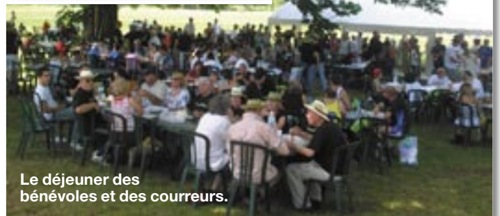
Le déjeuner des bénévoles et des coureurs.