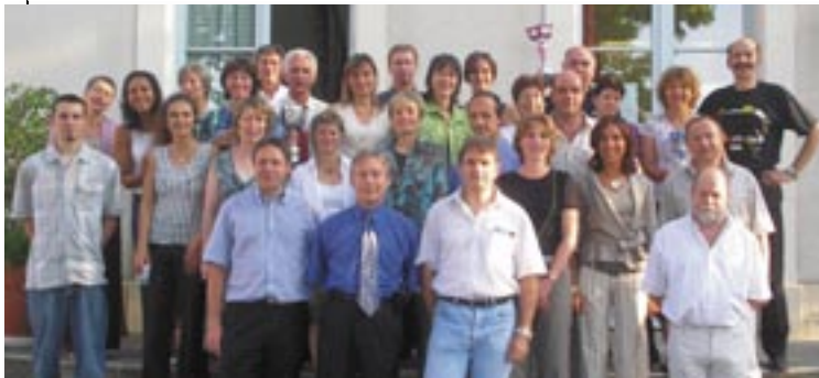
Un Festival de Coupes en Mairie de Guermentes où les 4 équipes victorieuses se sont retrouvées pour un pot très sympathique à l'invitation des Maires de Conches et de Guermentes.