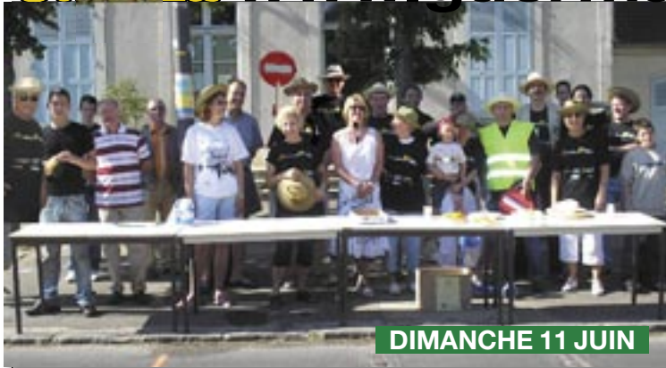
DIMANCHE 11 JUIN