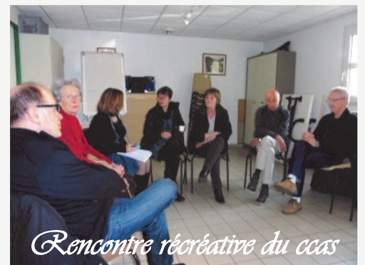
Rencontre récréative du ccas