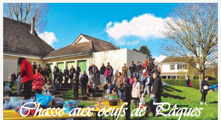
Chasse aux oeufs de Pâques