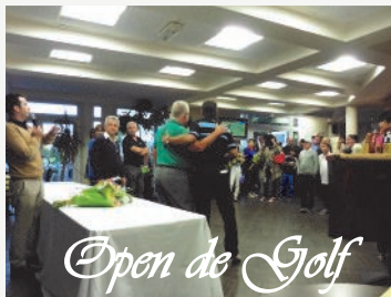
Open de Golf