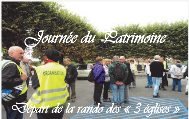
Journée du Patrimoine