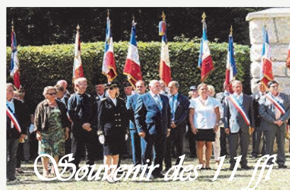
Souvenir des 11 fff