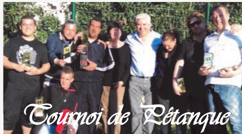
Tournoi de Pétanque