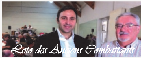
Loto des Anciens Combattants