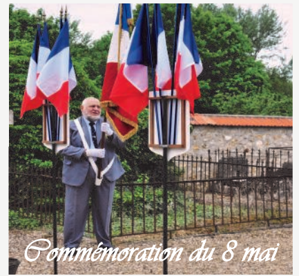
Commémoration du 8 mai