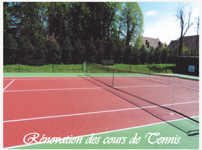
Rénovation des cours de Tennis