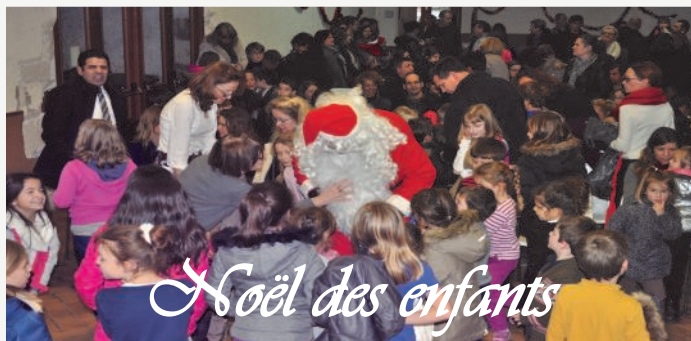
Noël des enfants