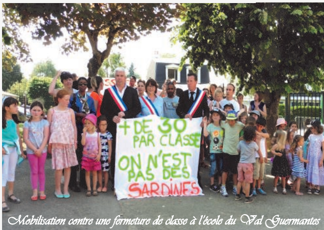
Mobilisation contre une fermeture de classe à l'école du Val Guermantes