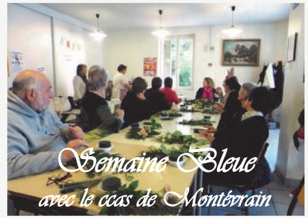
Semaine Bleue avec le coas de Montérrain