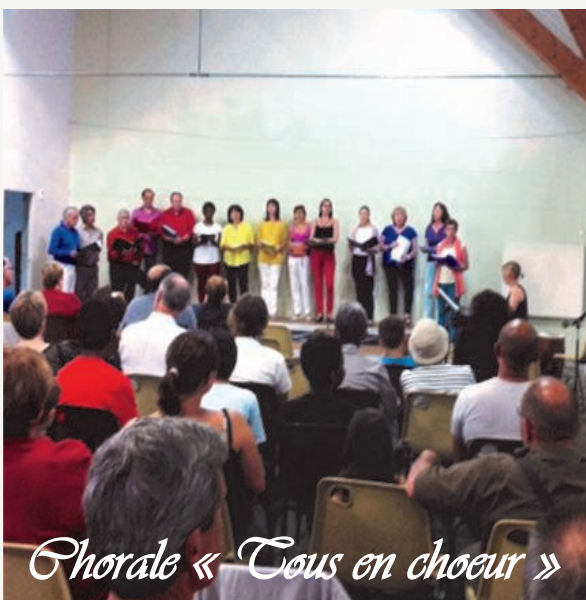
Chorale « Tous en chœur »