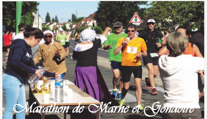
Marathon de Marne et Gondoire