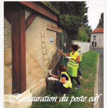
Restauration du poste edf