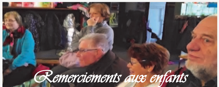
Remerciements aux enfants