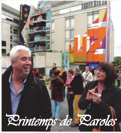
Printemps de Paroles