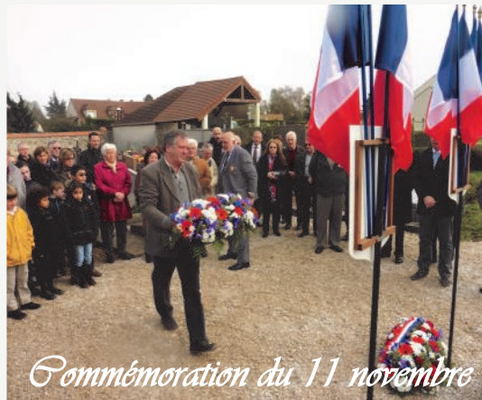
Commemoration du 11 novembre