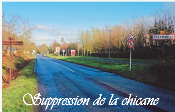
Suppression de la chicane