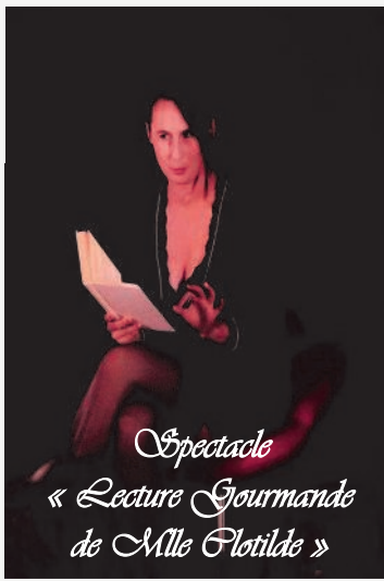
Spectacle « Lecture Gourmande de Mlle Plotilde »