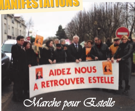
Marche pour Estelle