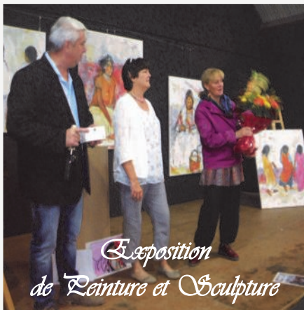
Exposition de Peinture et Sculpture