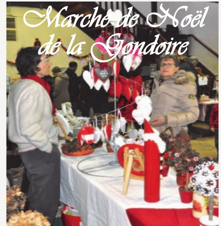
Marche de Noël de la Gondole