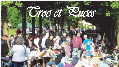
Troc et Luces