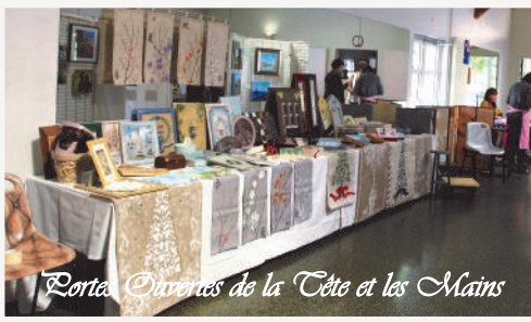
Portes Ouvertes de la Tête et les Mains