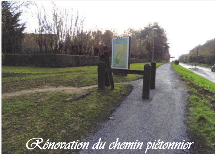
Rénovation du chemin piétonnier