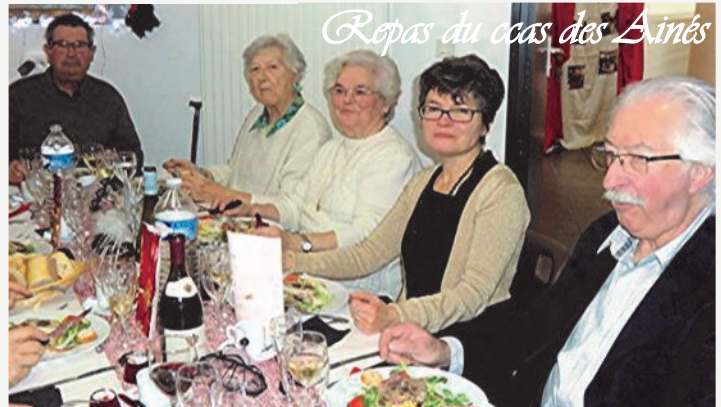
Repas du coas des Aînés