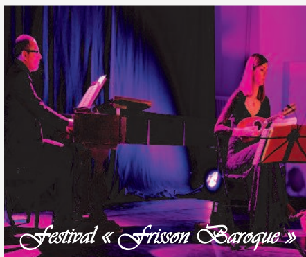
Festival « Frisson Baroque »