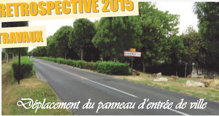
Déplacement du panneau d'entrée de ville