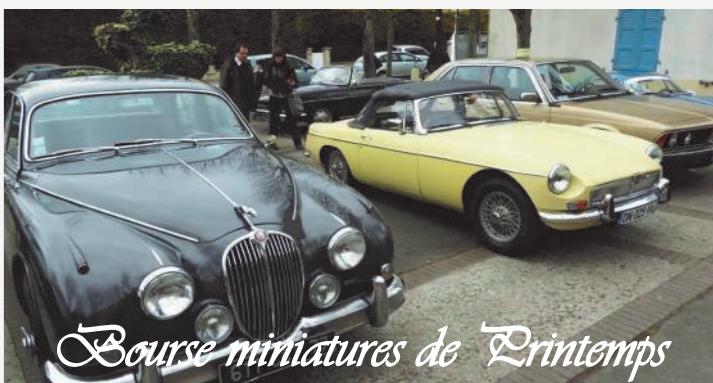
Bourse miniatures de Printemps