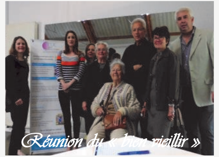
Réunion du «mon vieillir»