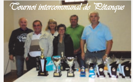
Tournoi intercommunal de Détanque