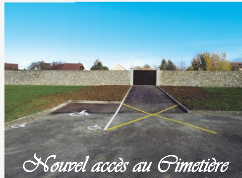
Nouvel accès au Cimetière