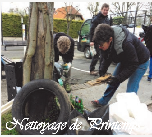
Nettoyage de Printemps