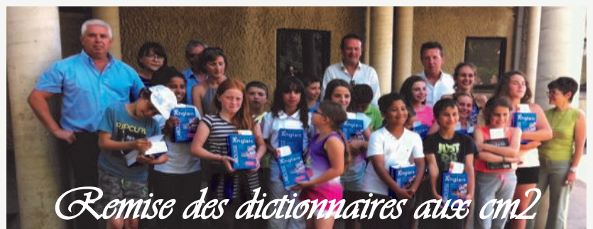
Remise des dictionnaires aux cm2