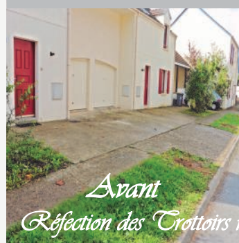
Avant Réfection des Trottoirs rue Blanche Hottinguer