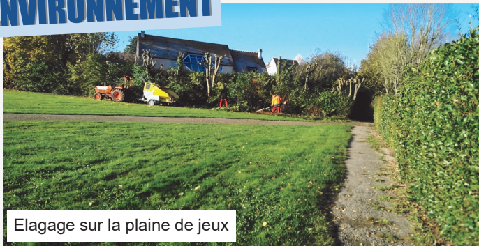
Elagage sur la plaine de jeux