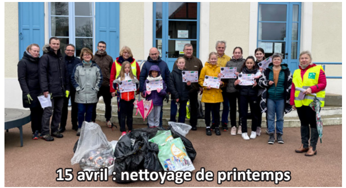
15 avril : nettoyage de printemps