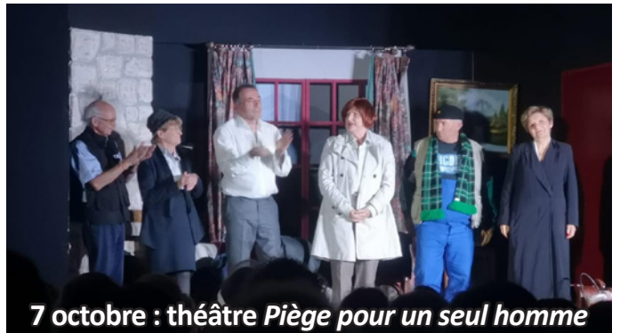
7 octobre : théâtre Piège pour un seul homme