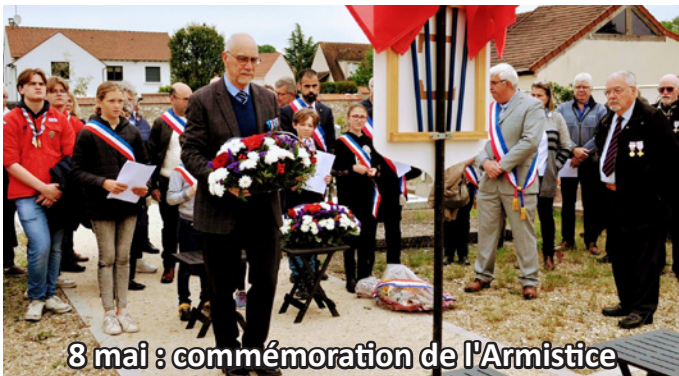
8 mai : commémoration de l'Armistice