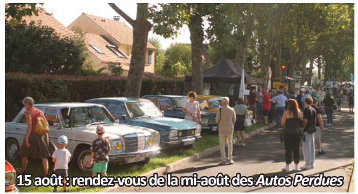
15 août : rendez-vous de la mi-août des Autos Perdues