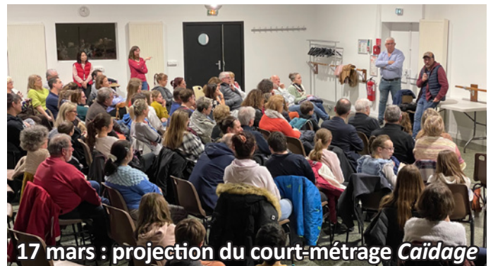
17 mars : projection du court-métrage Caïdage