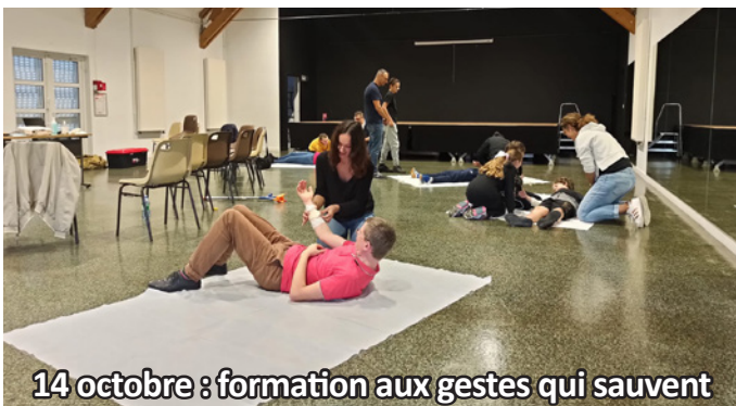
14 octobre : formation aux gestes qui sauvent