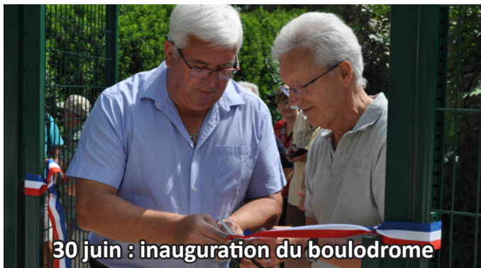
30 juin : inauguration du boulodrome