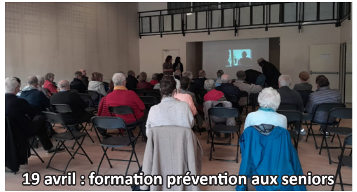
19 avril : formation prévention aux seniors