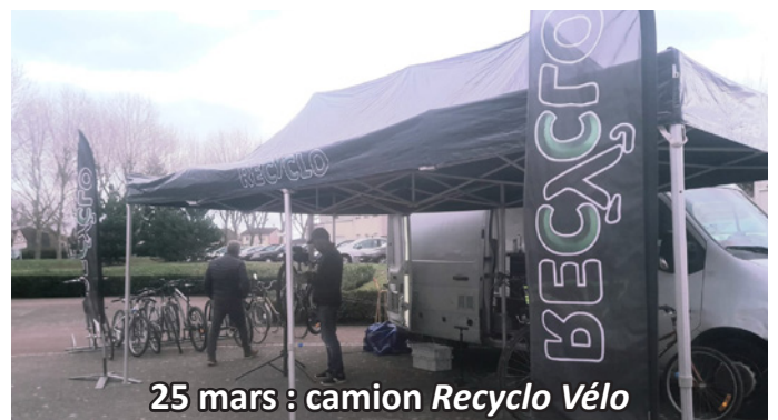
25 mars : camion Recylo Vélo