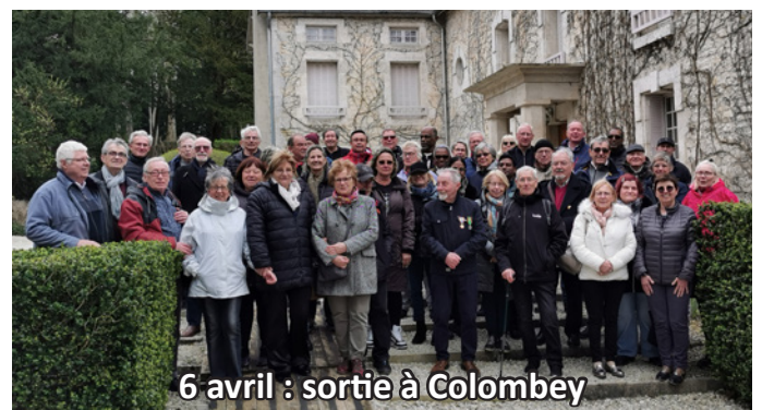
6 avril : sortie à Colombey