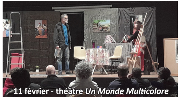
11 février - théâtre Un Monde Multicolore