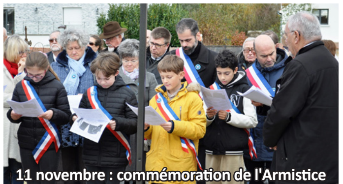
11 novembre : commémoration de l'Armistice