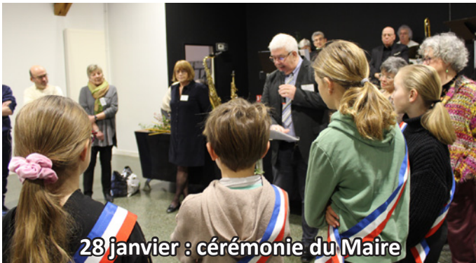
28 janvier : cérémonie du Maire