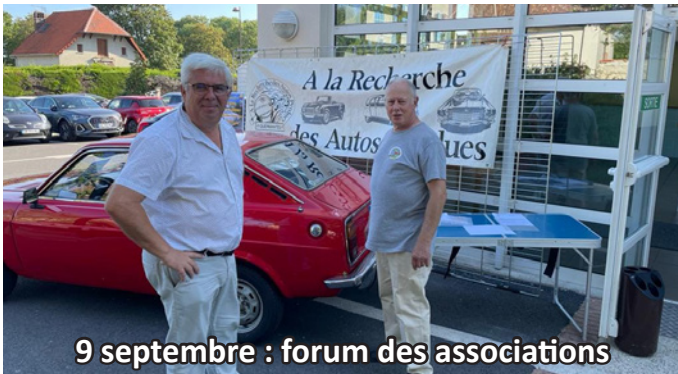
9 septembre : forum des associations