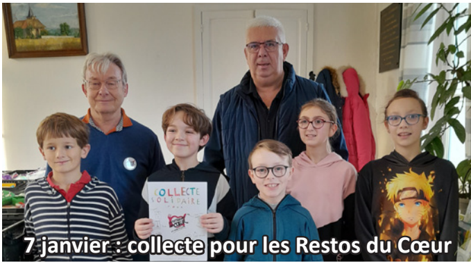
7 janvier : collecte pour les Restos du Cœur