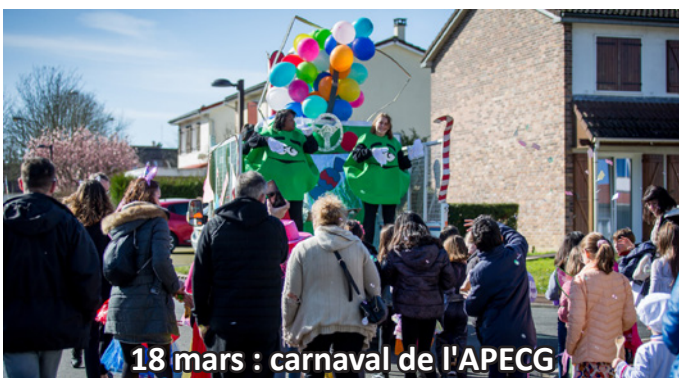
18 mars : carnaval de l'APECG