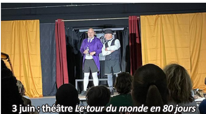
3 juin : théâtre Le tour du monde en 80 jours