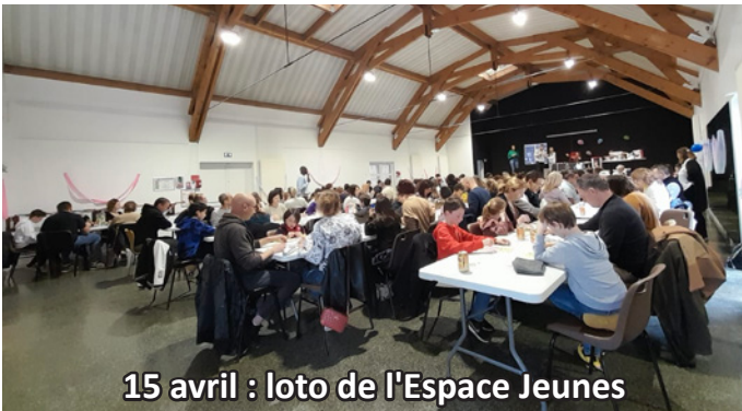
15 avril : loto de l'Espace Jeunes