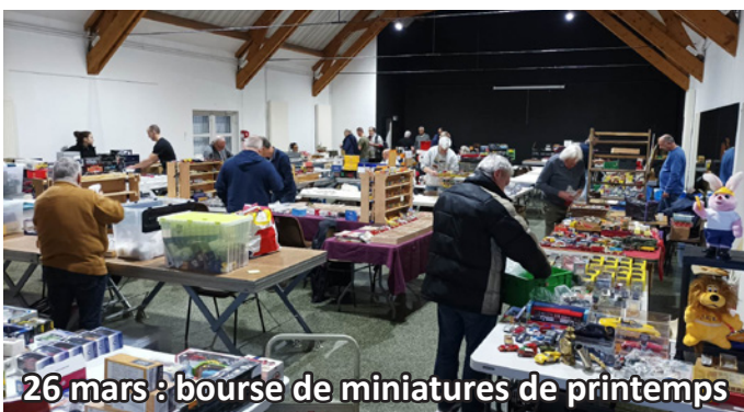
26 mars : bourse de miniatures de printemps