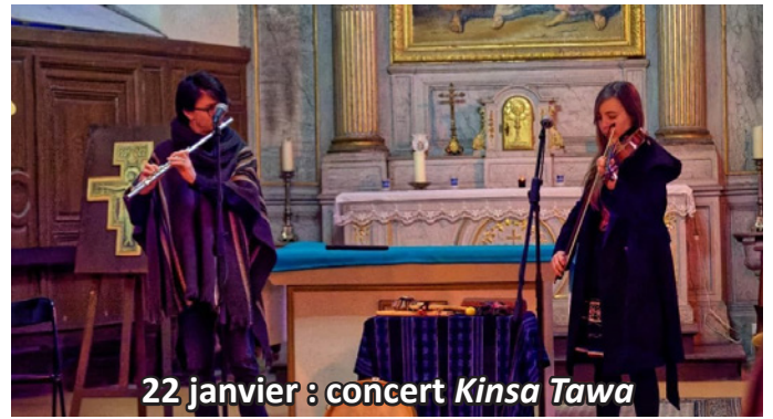
22 janvier : concert Kinsa Tawa