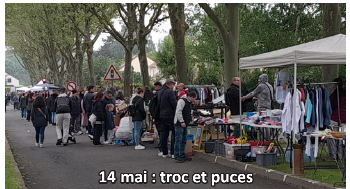
14 mai : troc et puces