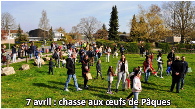
7 avril : chasse aux œufs de Pâques