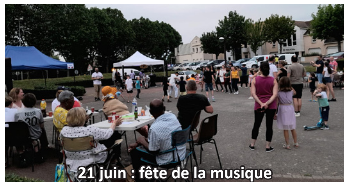
21 juin : fête de la musique