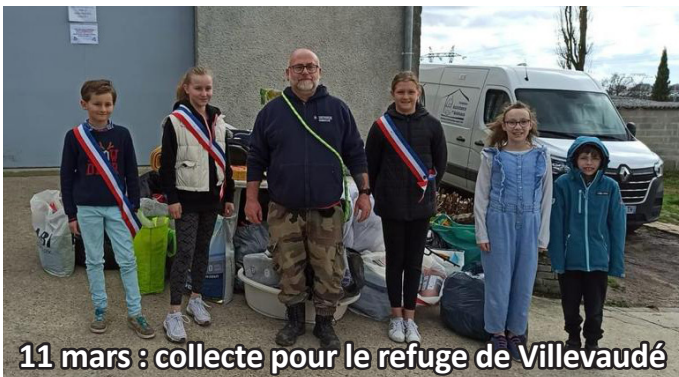
11 mars : collecte pour le refuge de Villevaudé