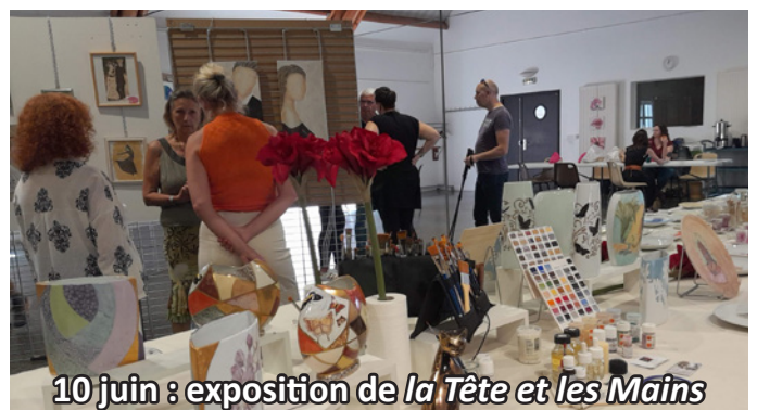
10 juin : exposition de la Tête et les Mains