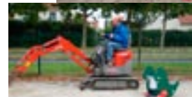
Drôles de machines pour drôles de dragons...