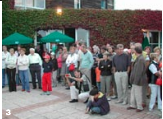
Photos sur le Site : www.guermantès.info > Rubrique Manifestations > Pages Souvenirs.