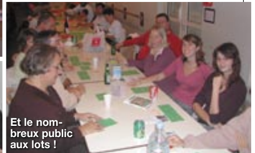
Et le nombreux public aux lots !