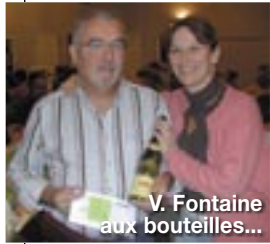
V. Fontaine aux bouteilles...

Prochaine édition le samedi 13 octobre 2007.