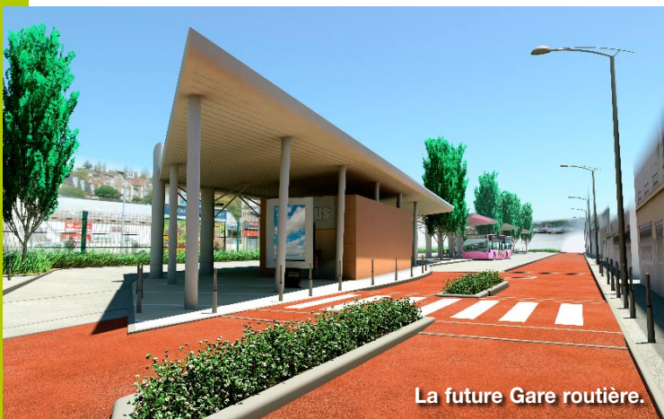
La future Gare routière.

Pour plus d'information, rendez-vous sur : www.marneetgondoire.fr