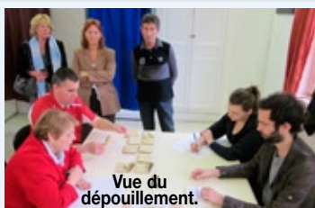
Vue du dépouillement.